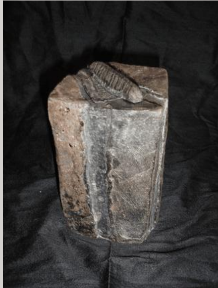
Illustration 1: Prix : 150 euros