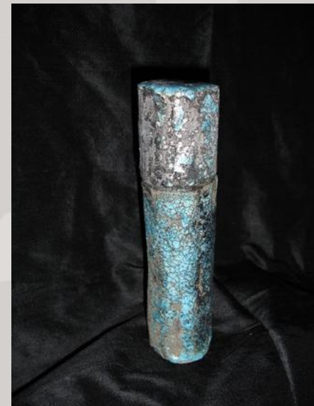
Prix : 120 euros