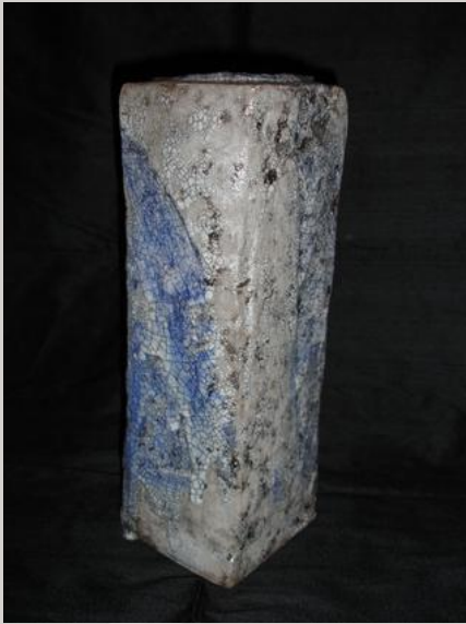
Prix : 250 euros