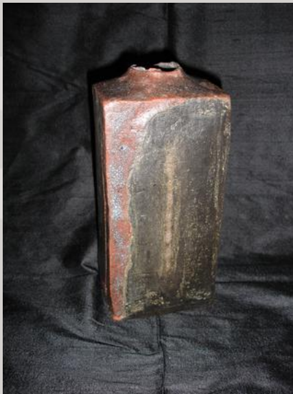
Prix : 200 euros