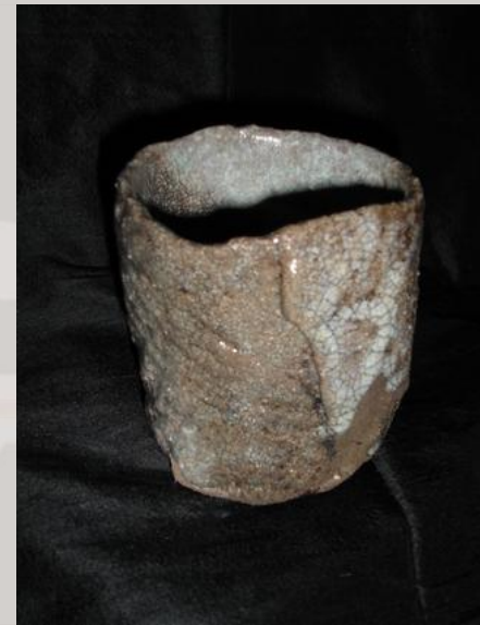
Prix : 150 euros