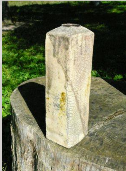
Prix : 250 euros