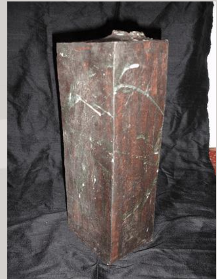
Prix : 300 euros