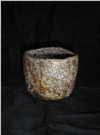
Prix : 250 euros