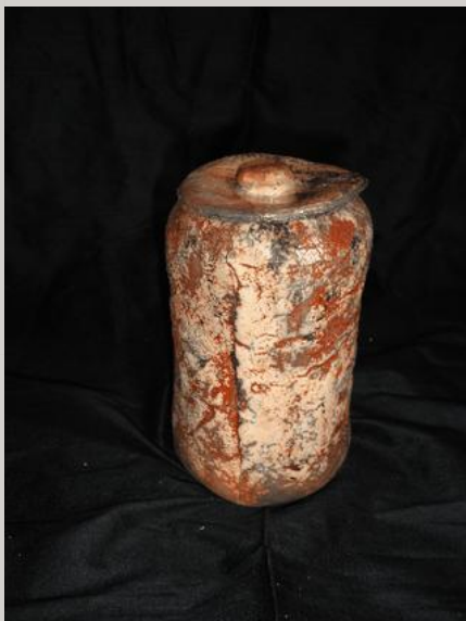
Prix : 120 euros