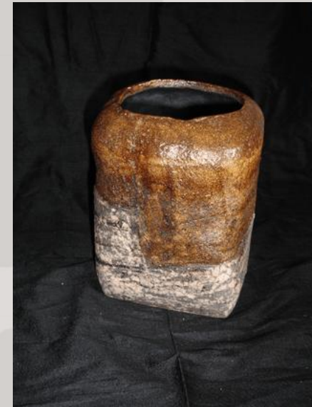
Prix : 150 euros