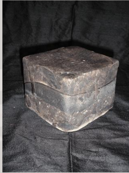
Prix : 120 euros