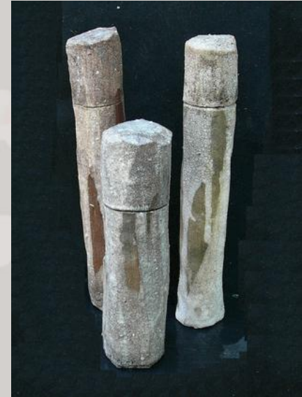
Prix : 120 euros pièce