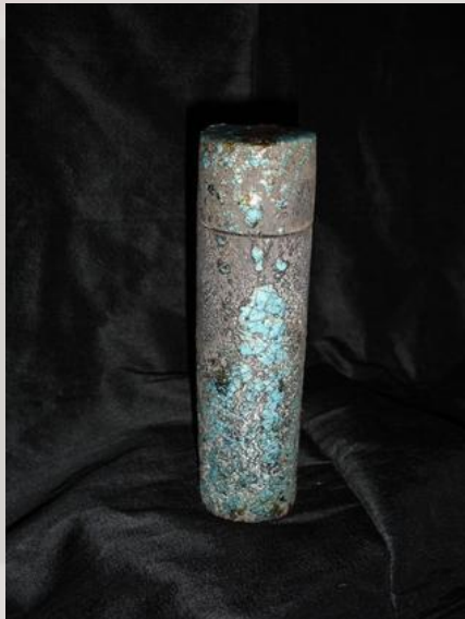
Prix : 120 euros