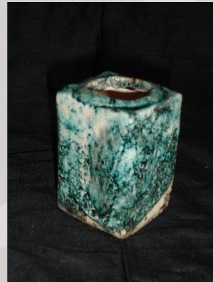
Prix : 75 euros