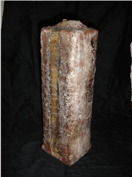
Prix : 300 euros