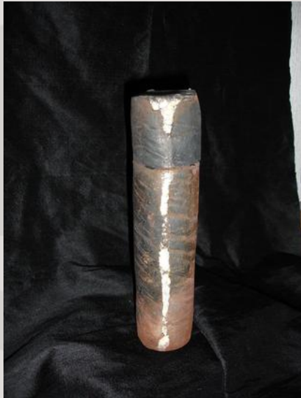
Prix : 120 euros