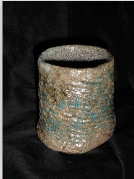
Prix : 120 euros