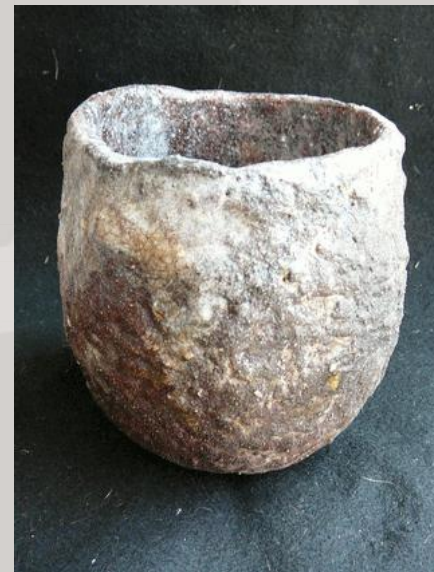
Prix : 150 euros