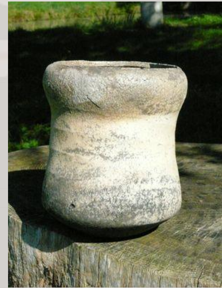
Prix : 250 euros