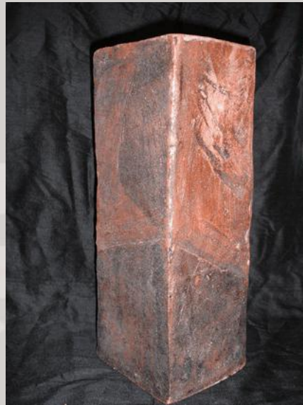
Prix : 350 euros