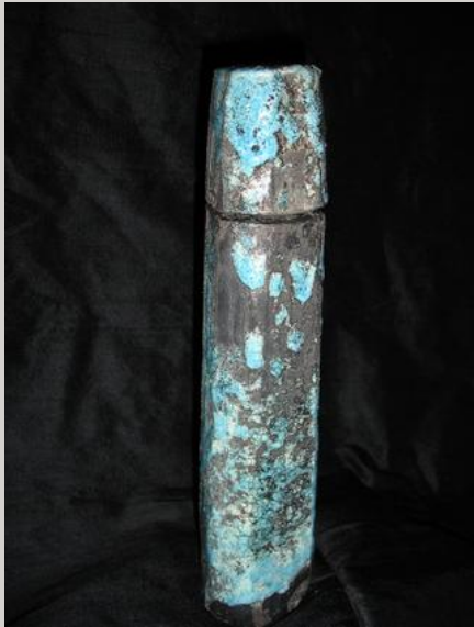
Prix : 120 euros