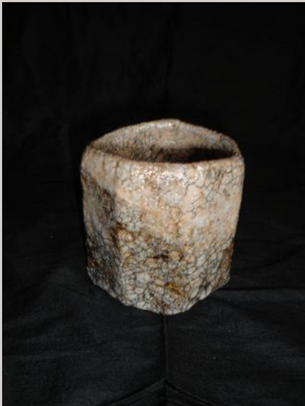
Prix : 150 euros