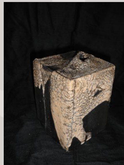
Prix : 200 euros