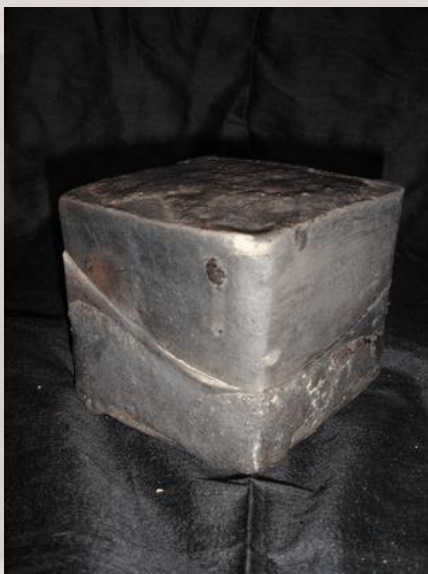
Prix : 120 euros