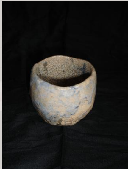
Prix : 120 euros