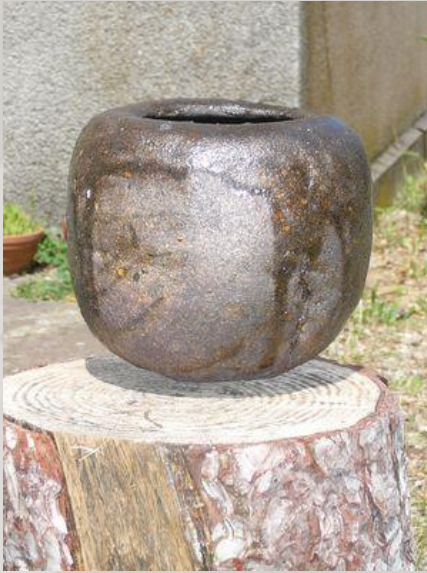
Prix : 250 euros