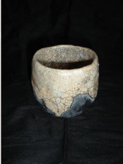
Prix : 120 euros