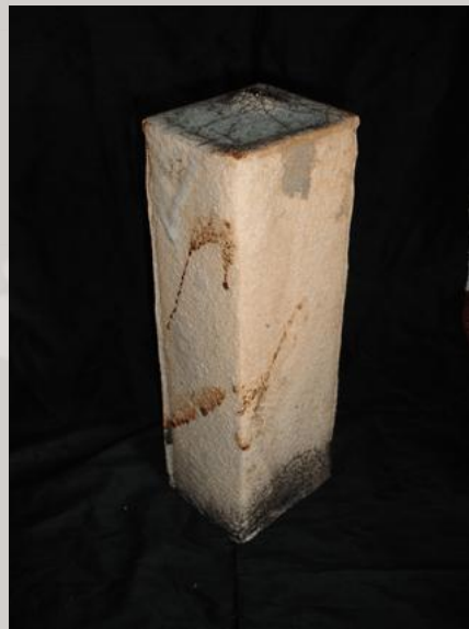
Prix : 200 euros