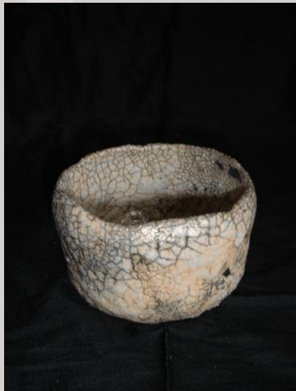
Prix : 120 euros