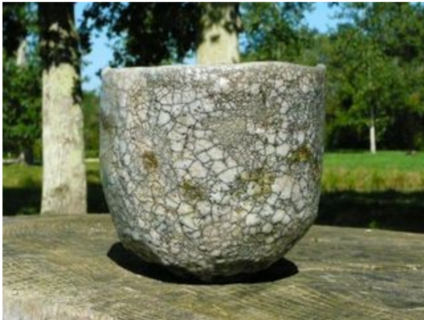
Bol « Glace » Hauteur : 10 cm - Diamètre 12 cm