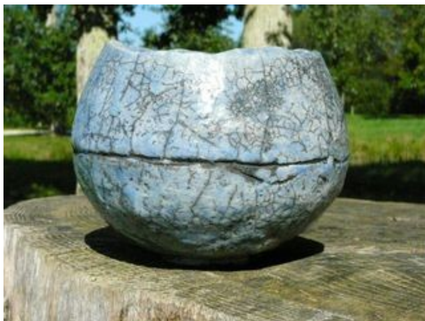
Bol bleu Hauteur : 11 cm - Diamètre 14 cm