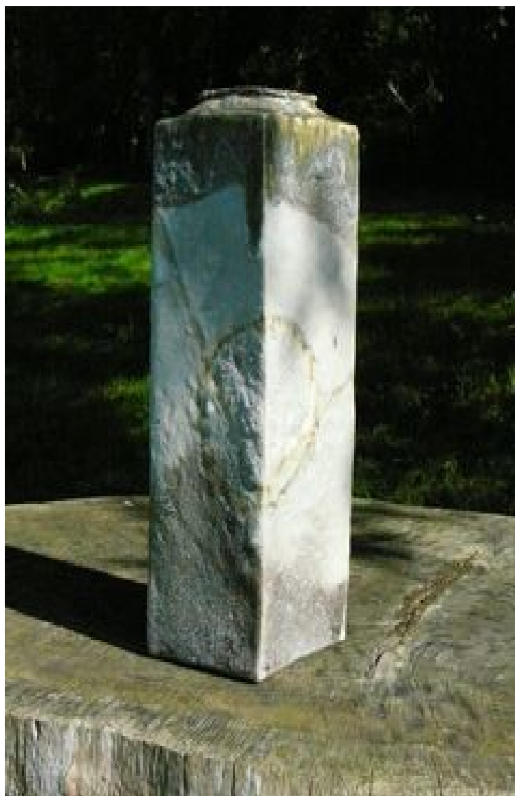
Bouteille Hauteur : 23 cm - Largeur 11 cm