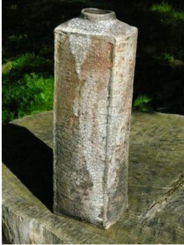
Bouteille Hauteur : 25 cm - Largeur 12 cm