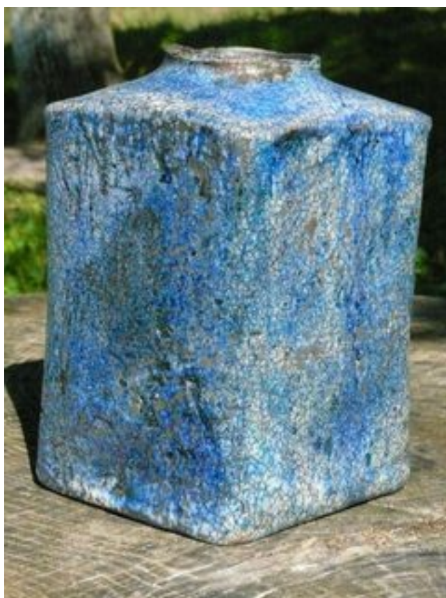
Bouteille bleue Hauteur : 18 cm Largeur 11 cm