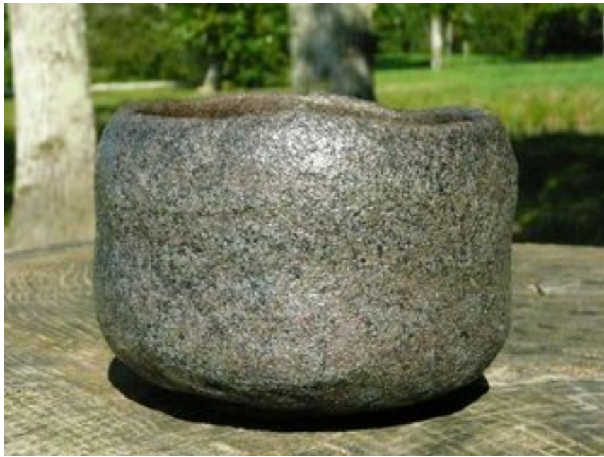
Bol volcanique Hauteur : 10 cm - Diamètre 12 cm