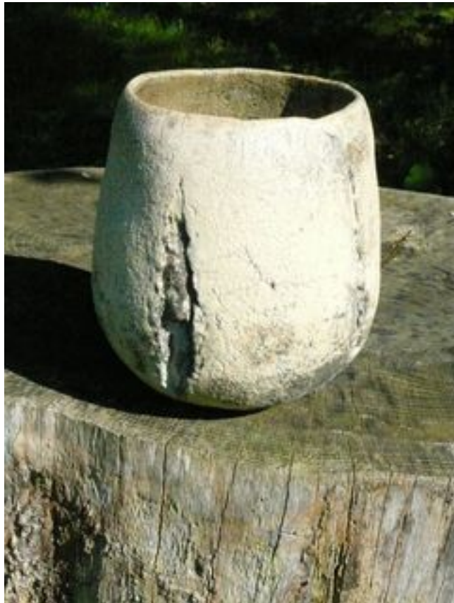
Contenant Hauteur : 20 cm Largeur 17 cm