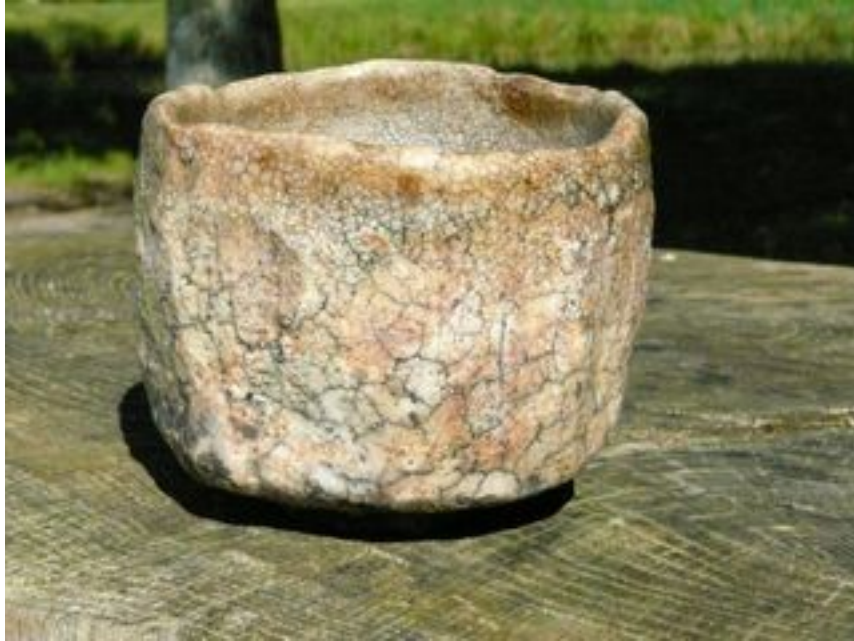
Bol rosé Hauteur : 9 cm - Diamètre 11 cm