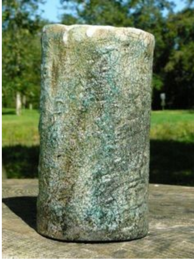
Tube Hauteur : 16 cm Largeur 9 cm