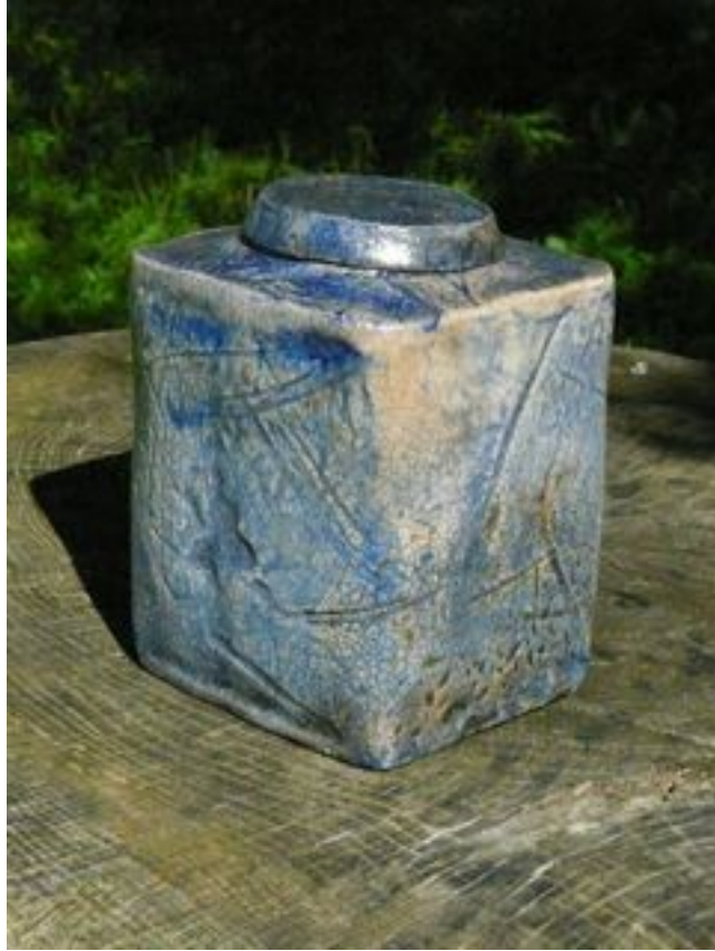
Boîte bleue avec couvercle Hauteur : 16,5 cm Largeur 12 cm