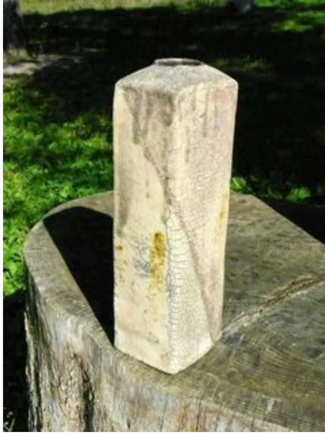
Bouteille Hauteur : 22 cm - Largeur 10cm