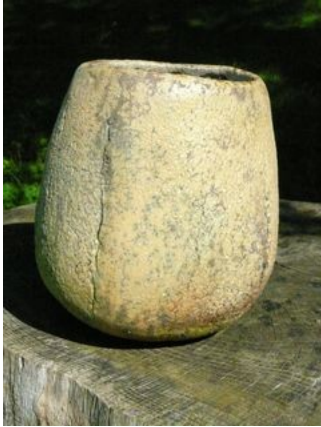
Contenant Hauteur : 20 cm Largeur 17 cm