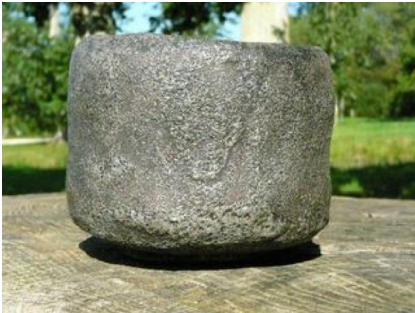
Bol volcanique « Sourire » Hauteur : 9 cm - Diamètre 11 cm