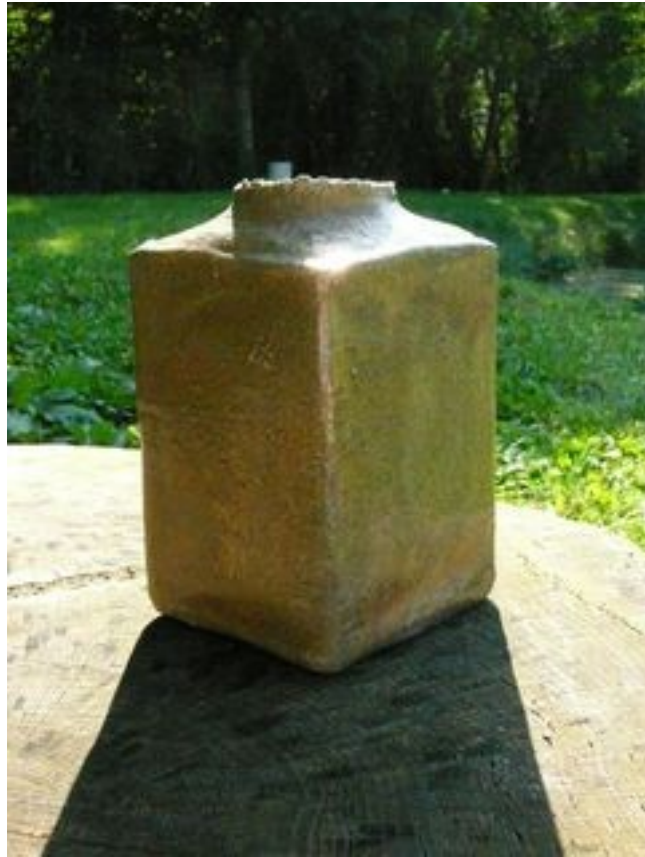
Bouteille Hauteur : 19 cm Largeur 11 cm