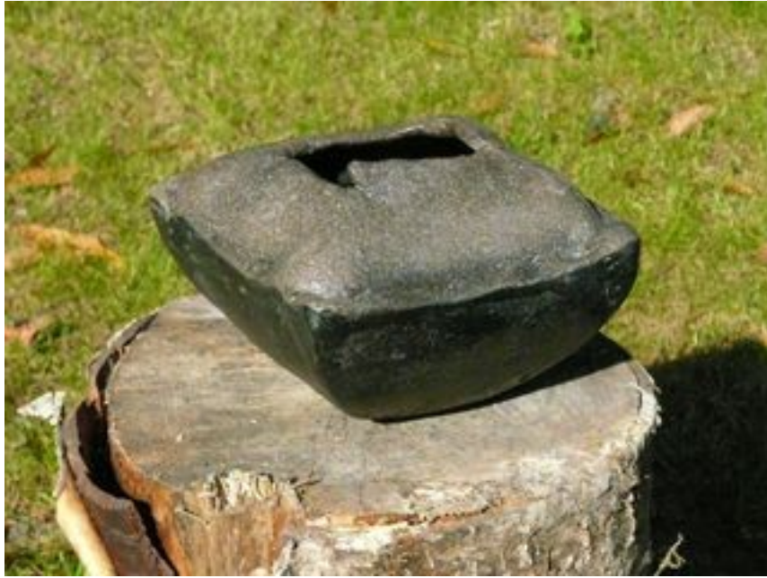
Contenant carré Hauteur : 7,5 cm Largeur 10 cm