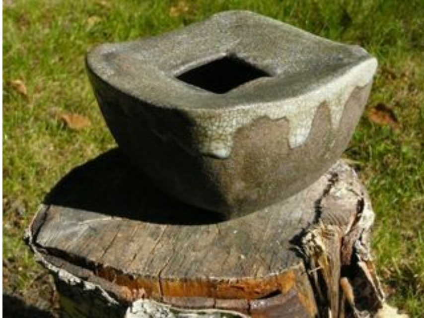
Contenant carré Hauteur : 11,5 cm Largeur 7 cm