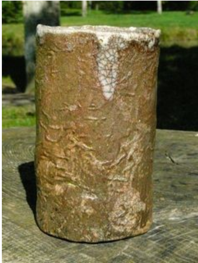
Tube Hauteur : 15 cm Largeur 9 cm