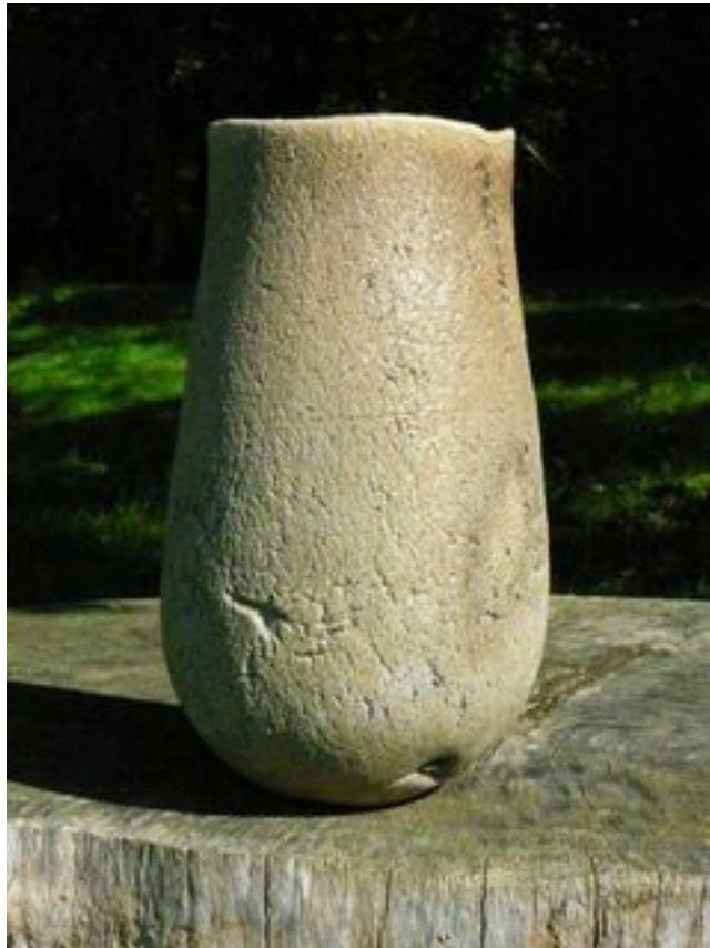
Contenant Hauteur : 25 cm Largeur 15 cm