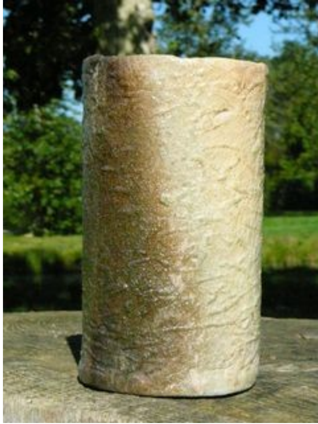
Tube Hauteur : 16 cm Largeur 9 cm