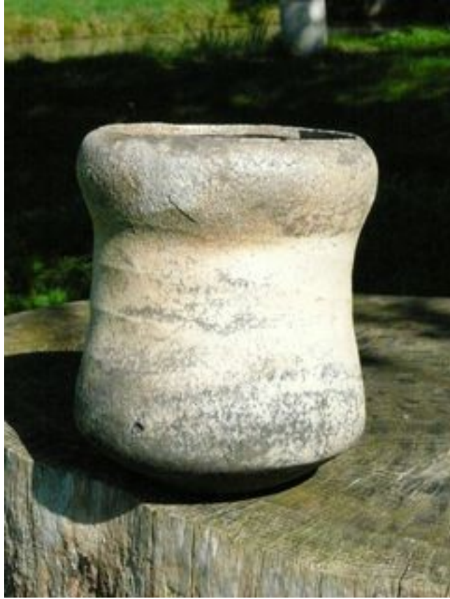
Contenant Hauteur : 19 cm Largeur 16 cm