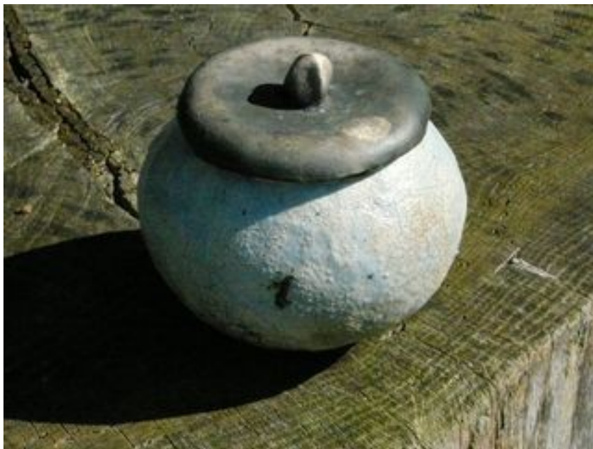
Boîte Boule Hauteur : 10 cm - Diamètre 11,5 cm