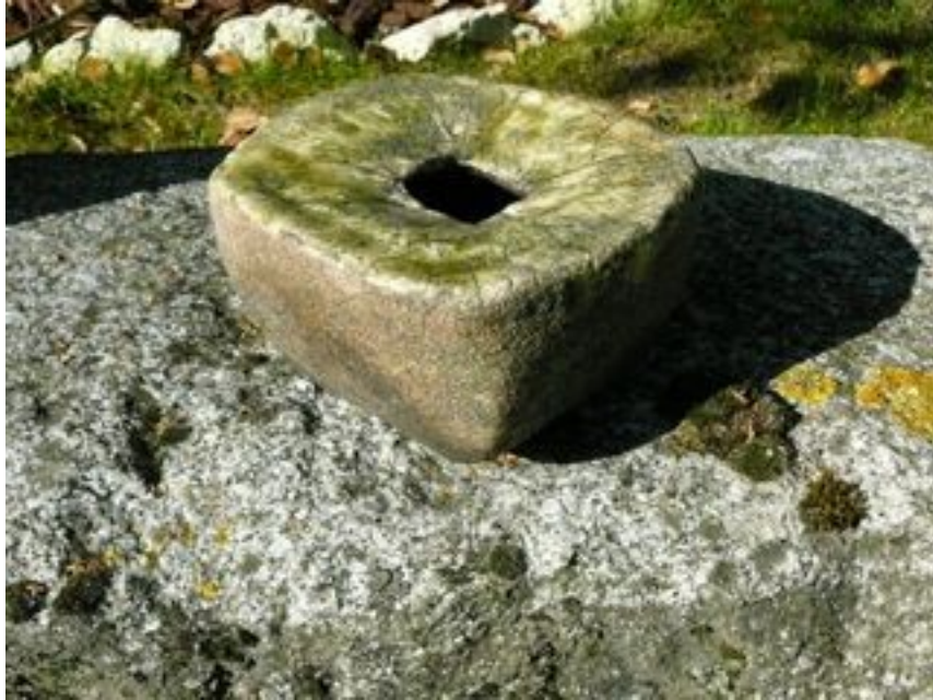
Contenant carré Hauteur : 8 cm Largeur 12 cm