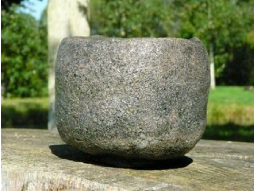
Bol Hauteur : 9 cm - Diamètre 10,5 cm